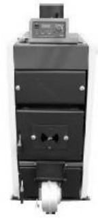
TABELA DANYCH TECHNICZNYCH

Do kotłów Ultima II zalecany jest węgiel kamienny o niewielkich lub średnich zdolnościach koksowania typ 31 lub typ 32 sortymentu groszek (GK), orzech (O) oraz mieszanka orzech (O) i groszek o wartości opałowej \geq 26 MJ/kg. Drewno opałowe o wilgotności do 20%. W wersji z palnikiem pelletowym – pelety o średnicy 6-8mm.